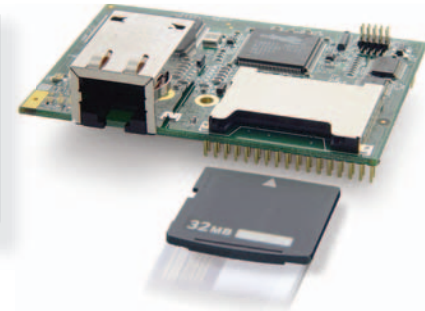
RabbitSys3365 -core moduuli